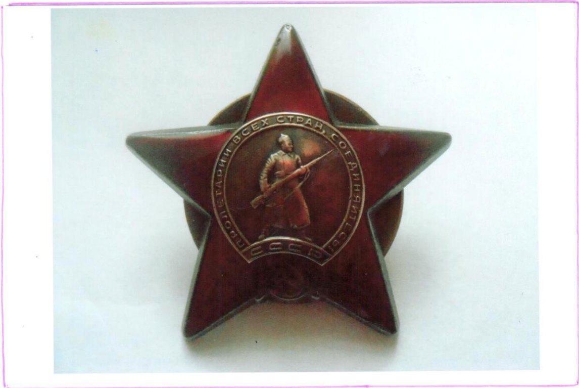
Орден Красной звезды